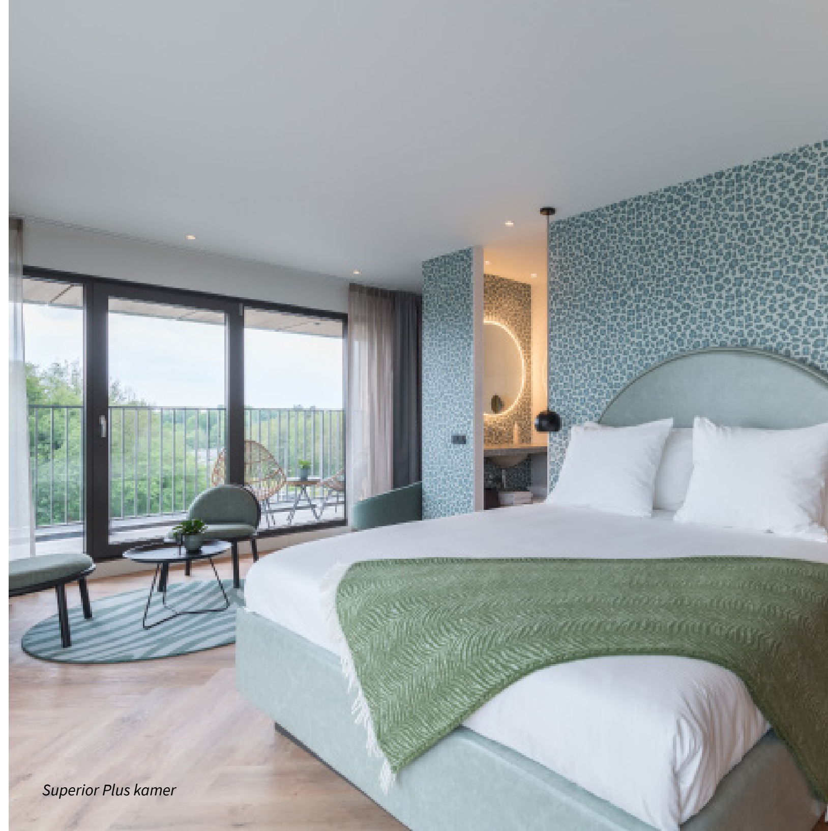
Superior Plus kamer

Voor het ontbijt, de lunch of een diner bent u van harte welkom in een van onze sfeervolle restaurants. In Restaurant V kunt u kiezen uit onze heerlijke à la carte kaart. Geniet van een zeer uitgebreid buffet en gerechten van The Black Bastard barbecues in ons Live Cooking restaurant Zest. In onze Hotelbar Ello kunt u terecht voor een (take away) trattoria gerecht met bijpassende koffie, thee of cocktail.