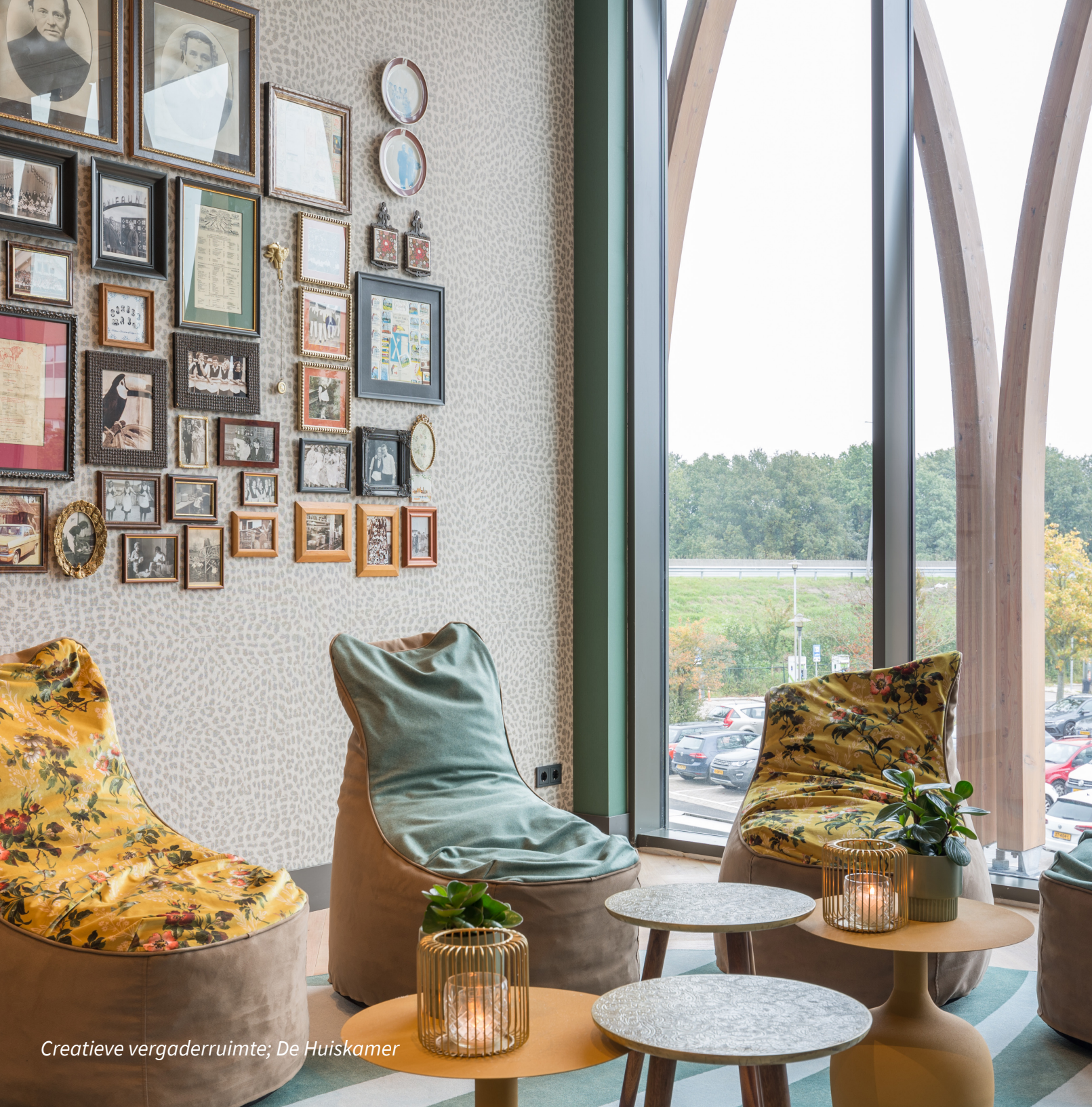
Creative vergaderruimte; De Huiskamer