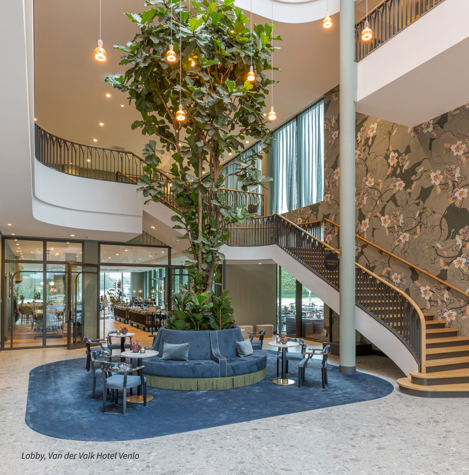
Lobby, Van der Valk Hotel Venlo