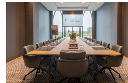
De Gouden Leeuw